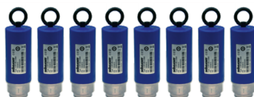
Mesure hors ligne avec jusqu'à 8 capteurs multipoints