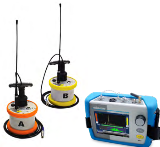
Emetteur de puissance (émetteur et capteur piézo)

Afin de maximiser la durée de fonctionnement de chaque émetteur, la radio est activée uniquement lorsque le capteur est connecté à celui-ci.