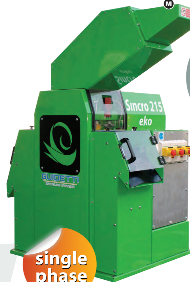
SINCRO 215 eko single phase

Versione monofase. Single phase. Version monophasé. Versión monofásica. Einphasige- Ausführung.