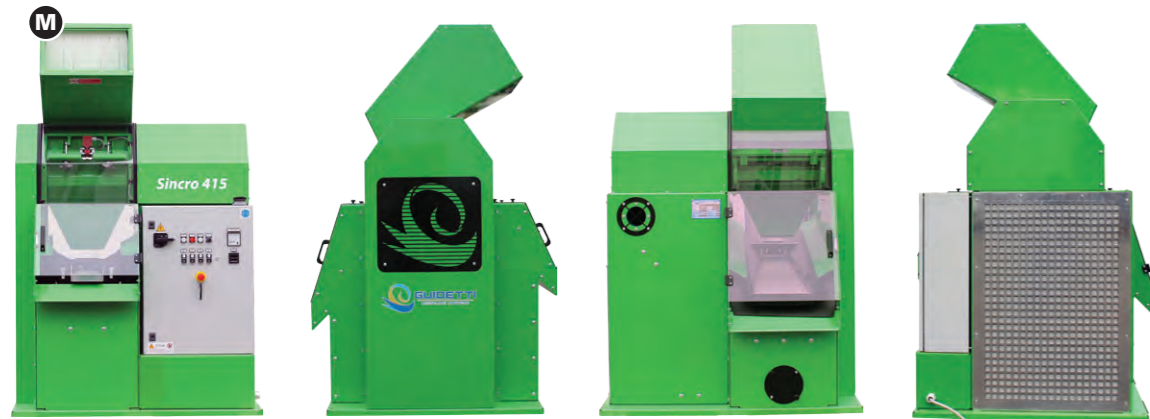
SINCRO 415 eko

In conformità alle norme CE. Conform to CE rules. Conformes aux réglementations CE. Son conformes a las normas CE. Conformit CE-regeln.