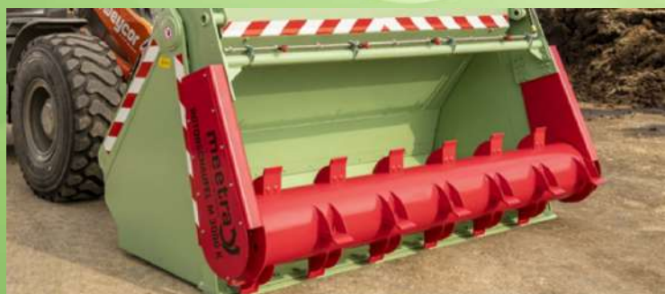
Godet à rotor