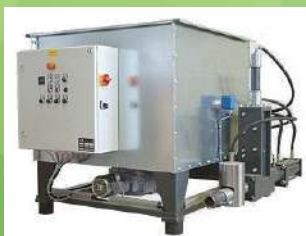
Presse à briquettes