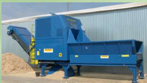
Broyeur rapide fixe