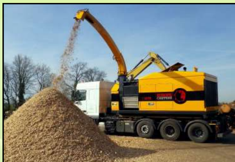
Déchetuse à tambour