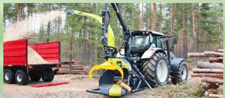
Déshiqueuse à disque