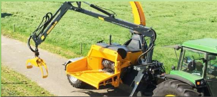
Déshiqueuse à tambour