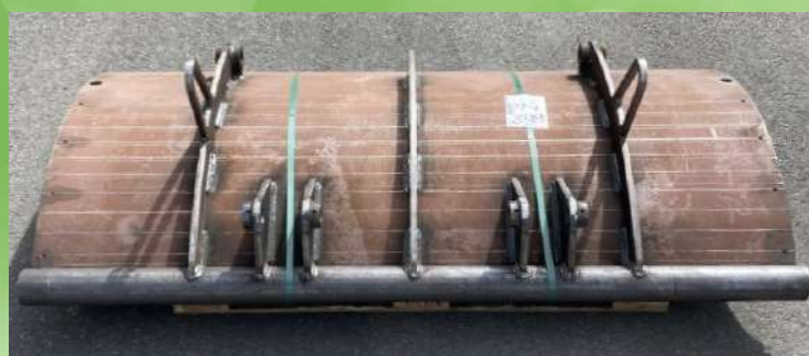
Plaques d'usure toutes marques Hardox