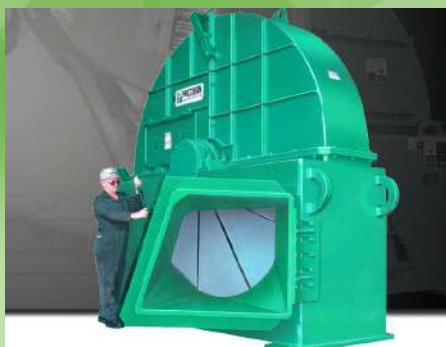
Déchetuse à disque