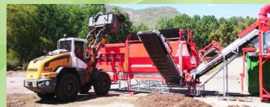
Ligne de criblage fixe