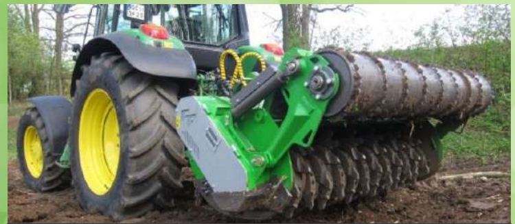
Broyeur Malaxeur déssoucheur