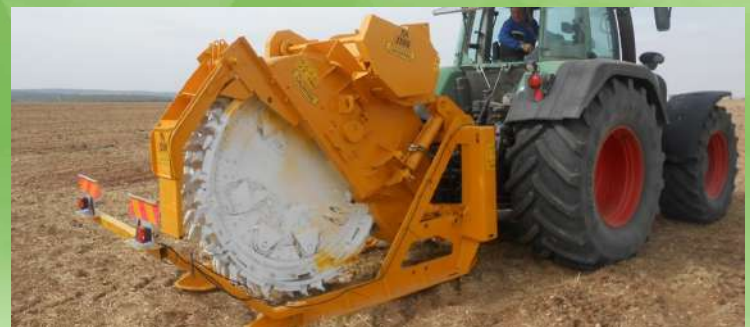
Trancheuse Pierres et Sols