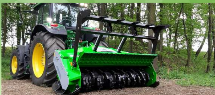
Broyeur forestier surface et sous sol