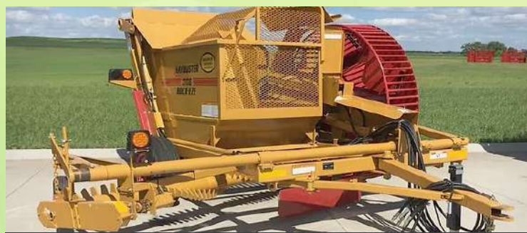
Ramasseur de pierres