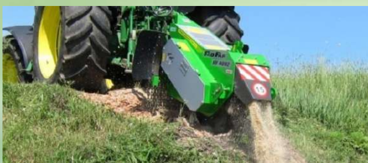
Broyeur en bandes / Rogneuse