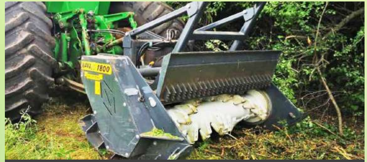
Broyeur forestier de surface