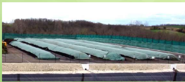
Bâche compost /Séchage plaquettes bois