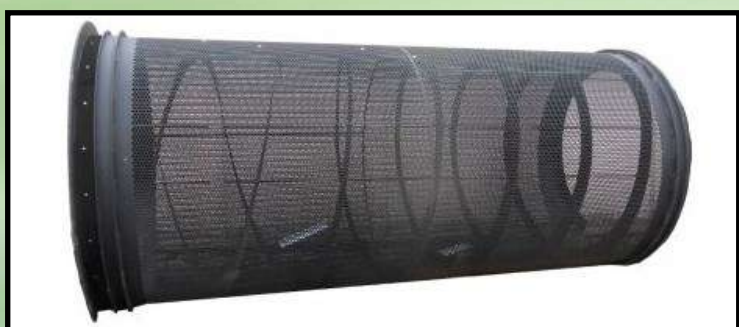
Trommels adaptables toutes marques