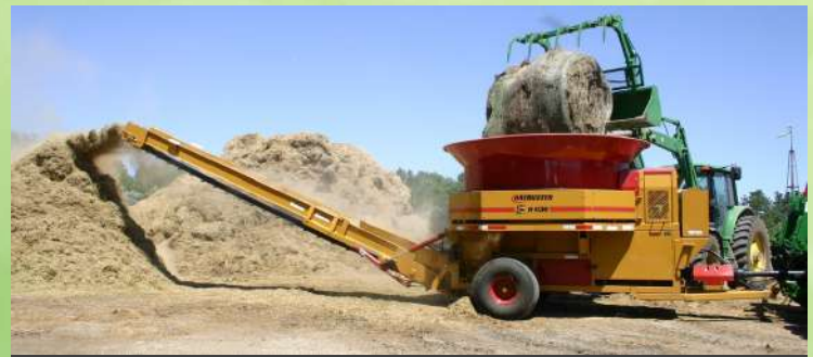
Broyeur paille et intrants méthanisation