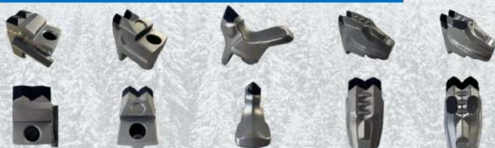
Pièces d'usure carbure de tungstène