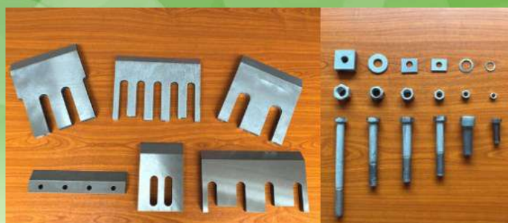
Lames déchiqueteuses, Visserie 10.9 12.9