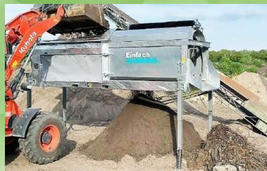
Crible trommel électrique