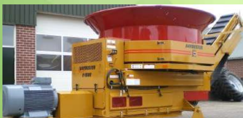
Broyeur à paille électrique