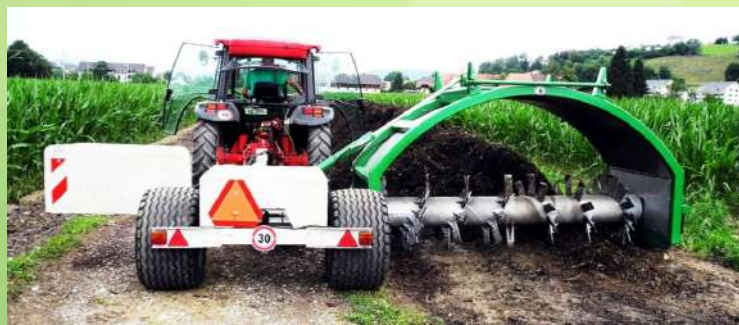
Retourneur de compost tracté