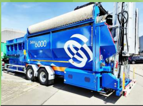
Cribleur à trommel