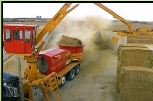
Broyeur paille à moteur