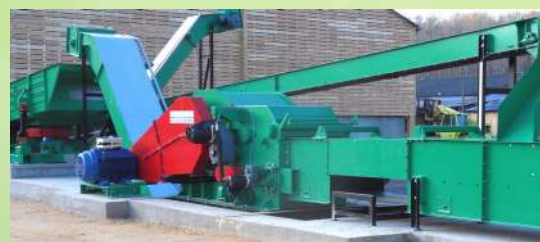
Ligne de valorisation bois