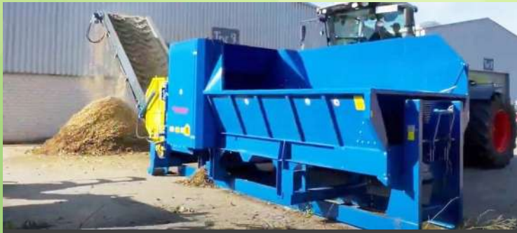
Broyeur rapide à prise de force