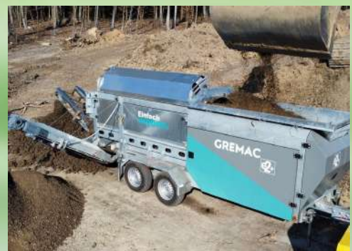
Crible Trommel 3,5 T