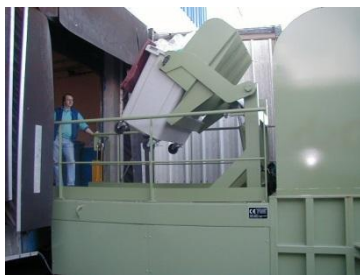
Chargement par basculeur à quai

FABRICATION FRANÇAISE SUR NOTRE SITE DE WATTIGNIES 59139