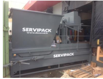
Compacteur reconditionné avec mise à quai