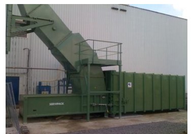
Chargement par goulotte extérieure