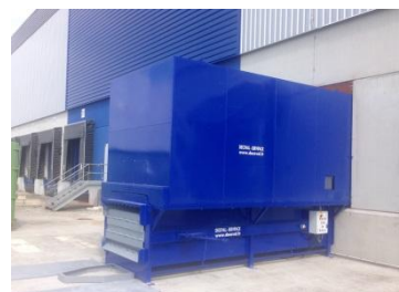
Tunnel sur mesure