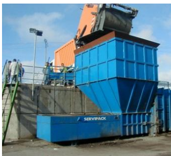
Trémie de chargement sur mesure