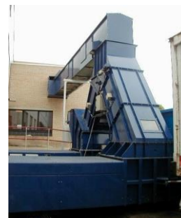
Chargement By pass