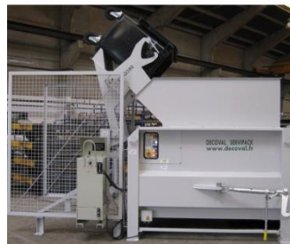
Compacteur court PC