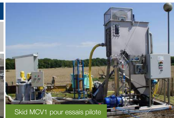
Skid MCV1 pour essais pilote