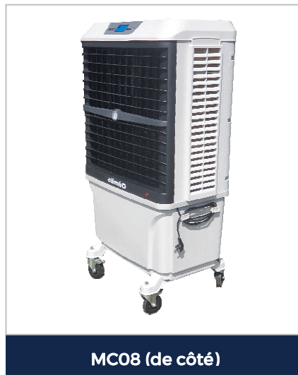
MC08 (de côté)