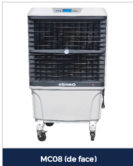
MC08 (de face)

Compacts et efficaces, les rafraichisseurs CLIMEO MC08 sont conçus pour les locaux de moyennes et grandes dimensions. Ils assurent une baisse de la température ambiante par l'action naturelle de l'eau et produisent un climat intérieur confortable en optimisant la température et l'hygrométrie.