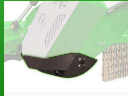
Patins spéciaux pour travail en profondeur