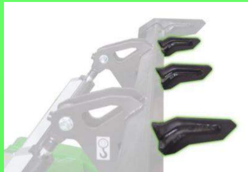
Kit de 3 dents pour rabatteur à souder