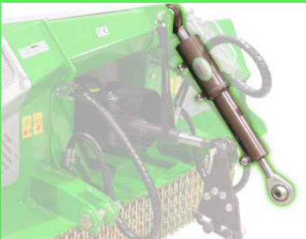
Troisième point hydraulique