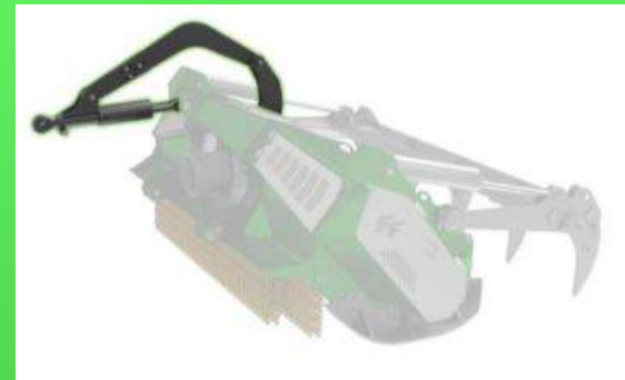
Alignement automatique supérieur