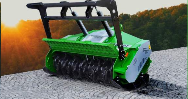
2361-DT largeur de travail 2300 mm, de 230 à 360 cv: