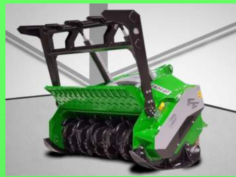
2054-DT largeur de travail 2000 mm, de 100 à 250 cv: