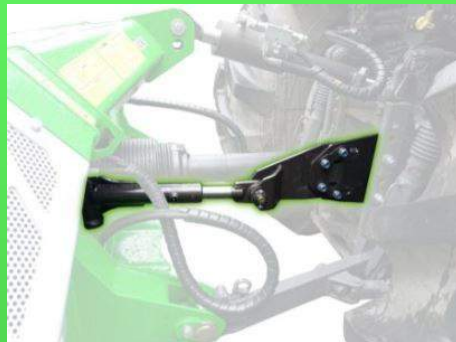
Alignement automatique inférieur