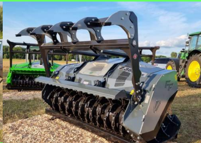
TABLEAU TECHNIQUE GAMME BROYEURS AVEC VISCOCOUPLEURS