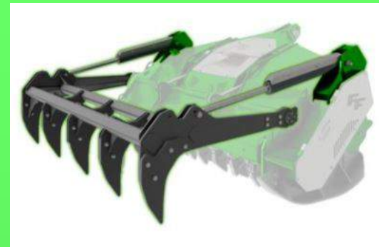
Rabatteur hydraulique à grand débattement à dents