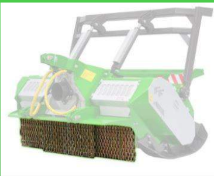
4 rangs de chaînes 1250 mm