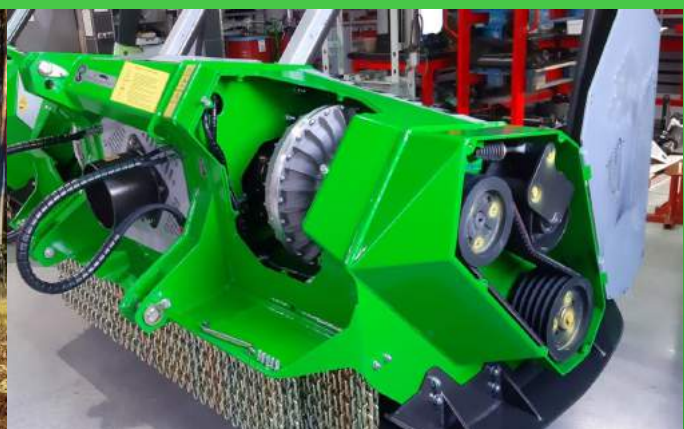
2353-DTS 2500 largeur de travail 2500 mm, de 170 à 260 cv: