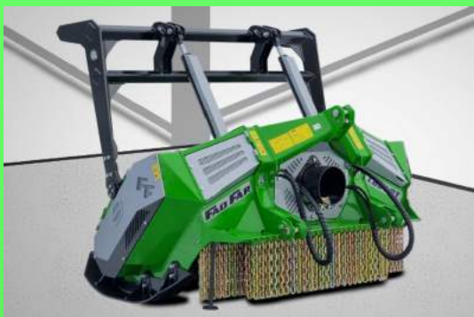
1854-DT largeur de travail 1800 mm, de 80 à 200 cv: