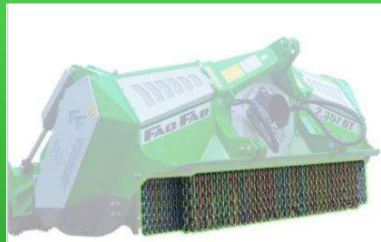
4 rangs de chaînes 1850 mm