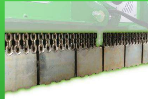
Ecran renforcé avec plaques en acier