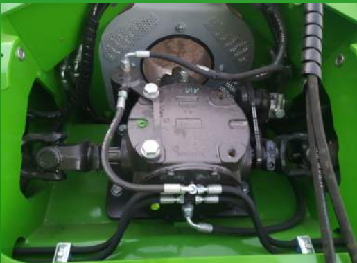
Système de lubrification avec pompe et filtre