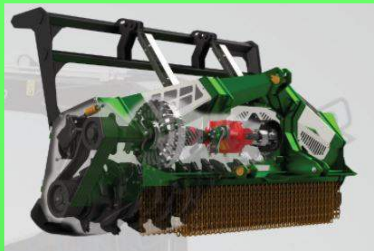
2353-DTS 2300 largeur de travail 2300 mm, de 140 à 260 cv: