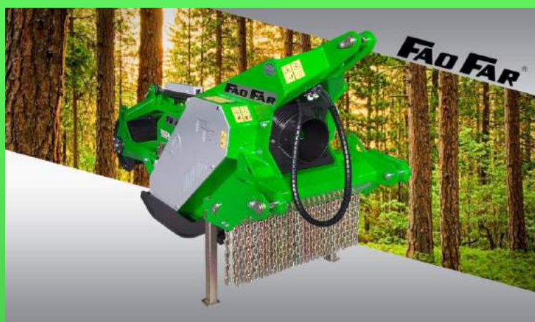
TABLEAU TECHNIQUE BROYEURS MALAXEURS