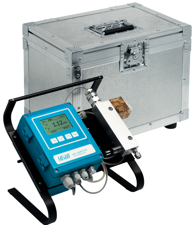
AMI INSPECTOR Fiche technique n° : au verso