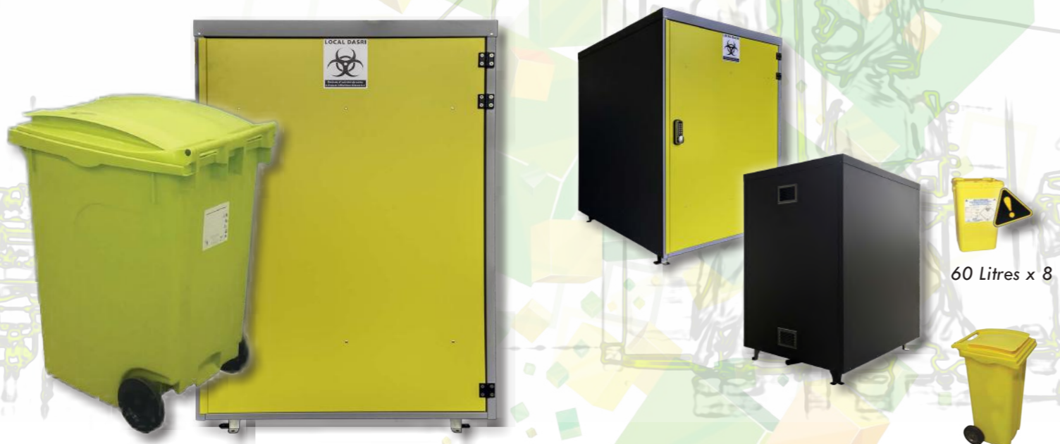
60 Litres x 8

Local d'entreposage temporaire pour DASRI