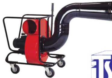
GUEPARD-2000 (Pour Poids Lourds)