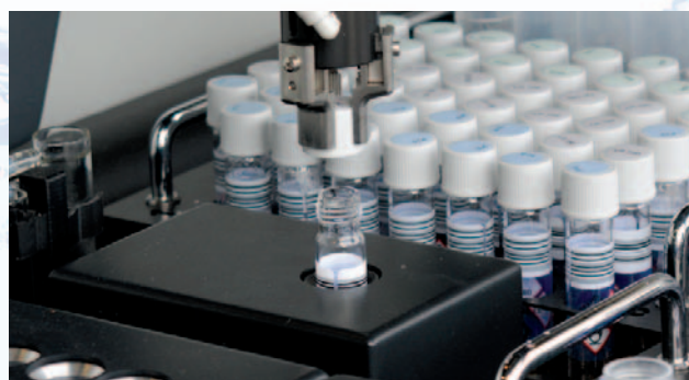
Bouchage du tube