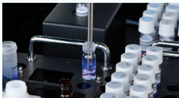
Pipetage de l'échantillon