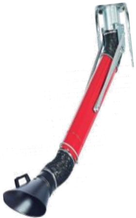
Bras de fumées de soudure télescopique