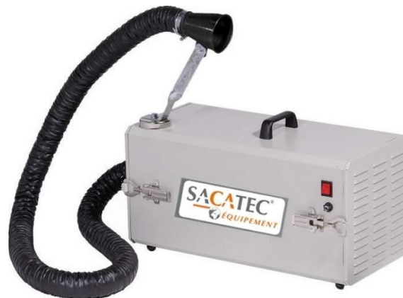
Unités filtrantes mobiles pour fumées de soudure et poussières