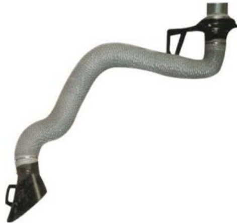
Bras de fumées de soudure en flexible à pantographe interne