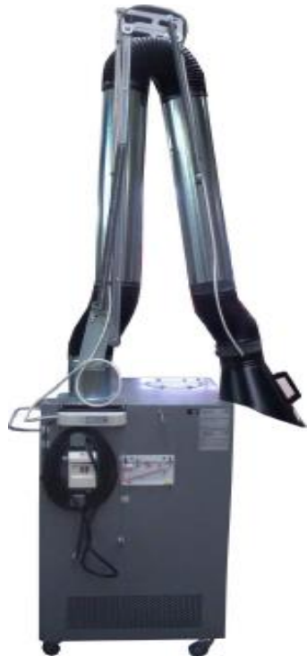
Unités mobiles d'aspiration et de filtration des fumées de soudure