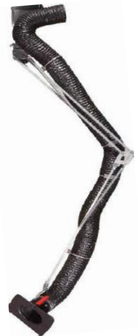
Bras d'aspiration de fumées de soudure à simple pantographe externe