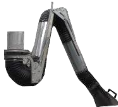
Bras de fumées de soudure métallique avec articulation externe