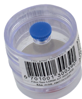
Cassettes de prélèvement