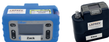
Pompes de prélèvement