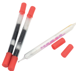
Tubes de prélèvement