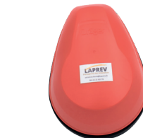
Auto sauveteurs filtrants