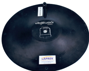
Vibrations corps entier