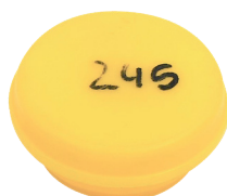
Mousse + coupelle CIP10