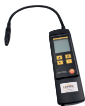
Recherche de fuites