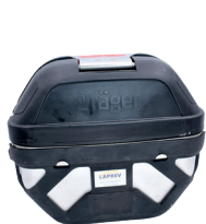
Auto sauveteurs isolants