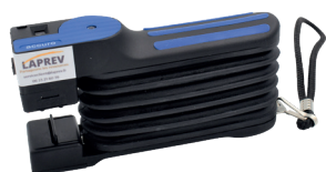
Pompe pour tubes réactifs