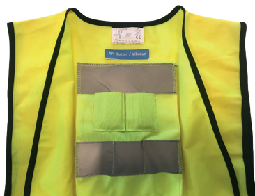
Gilet alarme postures inadaptées EN VENTE UNIQUEMENT