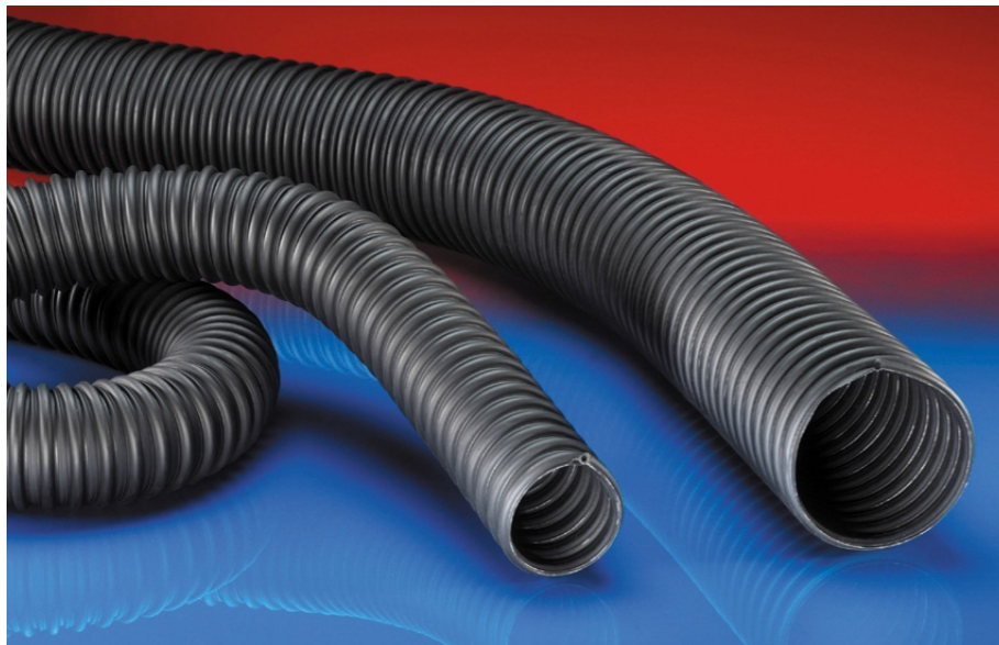
Type G-EX1 en fibre de polyester, renforcé par une spire de nylon anti-écrasement, (même après avoir été aplati il reprend sa forme initiale).

Résistant aux composés chimique, et à l'huile, lisse à l'intérieur et plis à l'extérieur pour un écoulement facile de l'air. Flexible léger et spire anti-écrasement (profil à mémoire de forme).