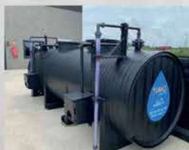
Cuve à réactif

La gamme TUBAO POTABLE est idéalement conçue pour répondre aux besoins liés à la gestion de l'eau destinée à la consommation humaine.