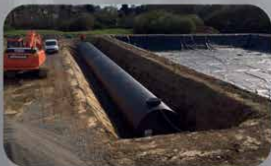
RÉSERVOIR DE STOCKAGE