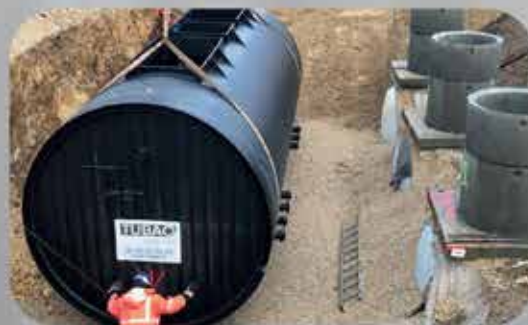
CHAMBRE DE SURPRESSION