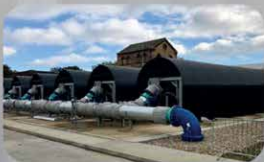
OUVRAGE DE CHLORATION