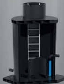
CHAMBRE DE CAPTAGE