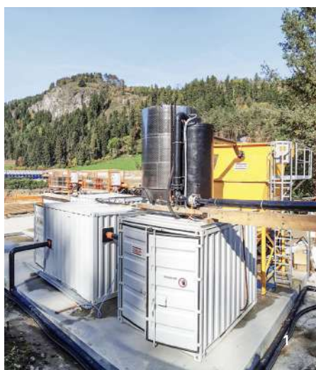
1 Installation de traitement des eaux de tunnel, Tyrol du Sud / 2 Installation de traitement des eaux de tunnel, Angleterre / 3-4 Installation de traitement des eaux de tunnel, Alto Maipo, Chili / 5 Installation de traitement des eaux de construction à plusieurs étages, Lyon, France

Vous trouverez ici une sélection d'installations de traitement des eaux de construction et de tunnel réalisées au Tyrol du Sud, en Angleterre, en Italie, en France et au Chili.