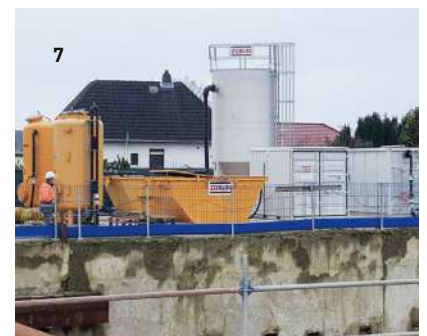
1 Traitement des boues, Elbdüker Dresde / 2 Installation de traitement des eaux de tunnel, tunnel Katzenberg / 3 Installation de traitement des eaux de tunnel, tunnel Rastatt / 4 Captage / traitement des eaux de construction, centrale thermique Mühlhausen / 5 Traitement des eaux de construction, Tunnel de l'aéroport de Stuttgart / 6 Traitement des eaux de construction, Oldenburg / 7 Traitement des eaux de construction, tunnel portuaire de Bremerhaven