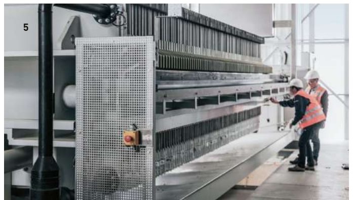
1 Filtres à bande sous vide / 2 Installations de traitement des boues, travaux de bétonnage sous-terrain, Stuttgart 21 / 3 Crible rotatif, tunnel Katzenberg / 4 Station de préparation et dosage de flocculant / 5 Filtre-presse automatisée