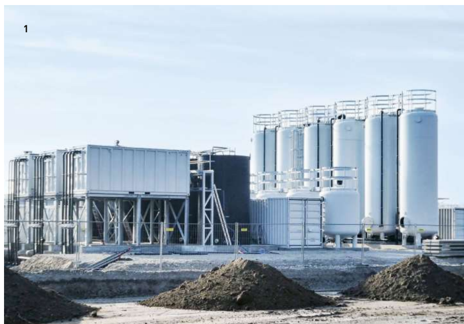
1 Bassin de sédimentation, filtres à sable et à charbon actif, IN-Campus Ingolstadt / 2 Installation de traitement des eaux, épuration du sol, IN-Campus Ingolstadt / 3 Bassin de sédimentation, centrale thermique Mühlhausen

Les étapes du processus telles que la sédimentation, la filtration et la neutralisation sont appliquées le plus fréquemment. Des débits allant de 1 l/s à plusieurs centaines de l/s sont réalisables.