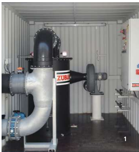
1 Installation mobile d'aspiration de réservoirs / 2 Traitement des émissions polluantes hautement concentrées / 3 Installation de traitement des effluents gazeux / 4 Ventilation des structures et traitement des émissions polluantes