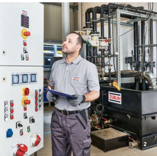
1 Site de Markgröningen / 2 Atelier de réparation des pompes / 3 Réalisation en 3 D d'une installation de traitement des eaux de construction / 4 Installation de traitement des eaux de construction, échangeur de Wendlingen

Nous portons une attention toute particulière à la sécurité au travail et à la santé du personnel sur nos chantiers. Ainsi, nous avons introduit le système de gestion correspondant en conformité avec les normes DIN 45001:2018 et SCCP: 2011.